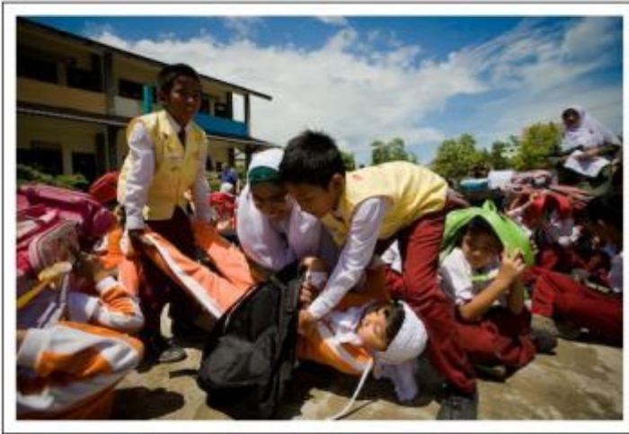
Siswa mengevakuasi temannya yang menjadi korban saat mengikuti simulasi gempa di Sekolah Dasar Negeri 2 Punge Jurong, Banda Aceh, Senin (11/6). Ratusan siswa dikutkan simulasi ini dan sebagai upaya sekolah dalam mengantisipasi pengurangan risiko bencana (PRB) sejak usia dini bagi para murid.