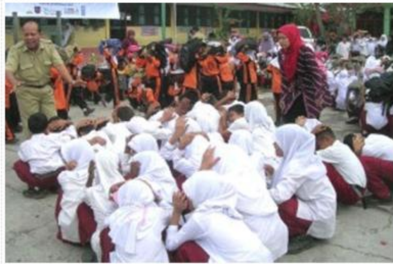
Ilustrasi uji coba prosedur tetap/Standart Operasional Prosedur (SOP) penanggulangan bencana (ist)

108CSR.com - Sedikitnya 600 murid sekolah dasar di Kota Banda Aceh dilibatkan dalam uji coba prosedur tetap/Standart Operasional Prosedur (SOP) penanggulangan bencana