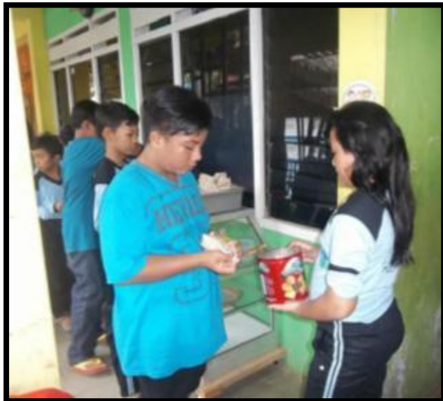
Budaya antri diterapkan pada saat membeli di kantin kejujuran dan beberapa siswa bertugas sebagai kasir sesuai dengan jadwal piket kantin